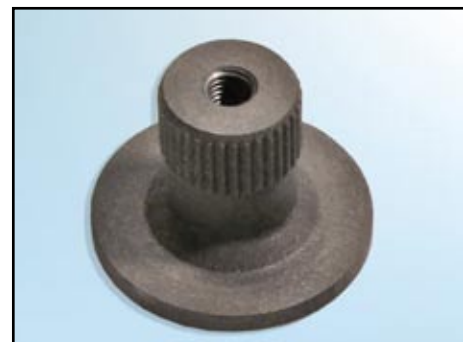
Foto 2: Adapter 3064 8510

Zawsze postępuj zgodnie z zaleceniami producenta pojazdu !