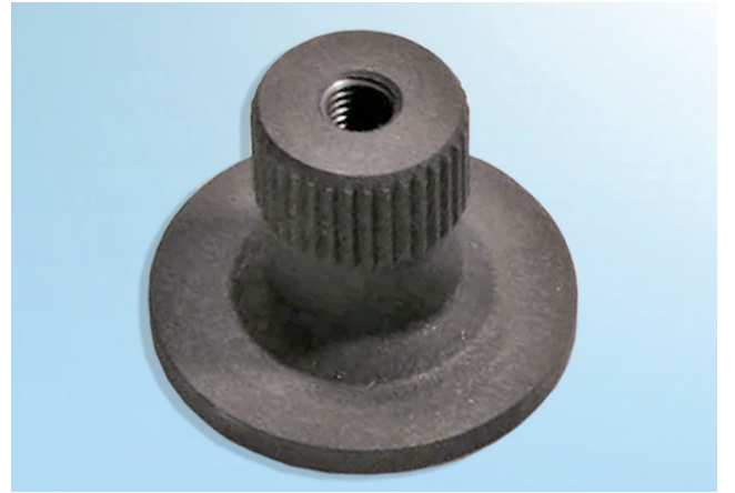
Şekil 1: Adaptör - 30648510

İlgili parça referanslarını, www.schaeffler.com.tr veya www.repxpert.com.tr adreslerindeki online kataloglarımızdan bulabilirsiniz.