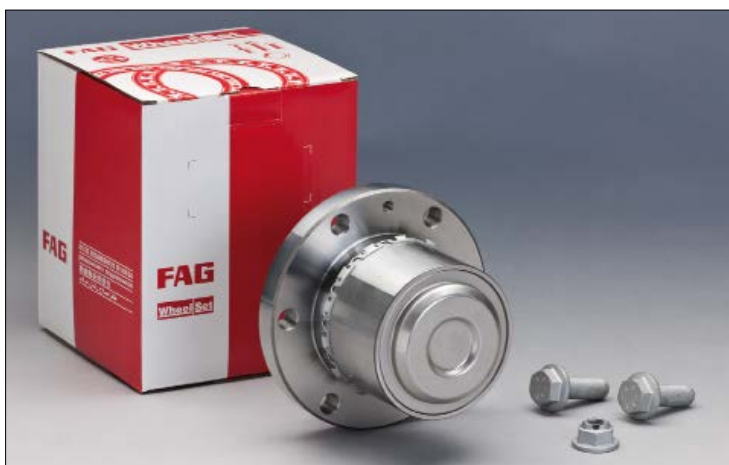
Slika 1: Jedinica ležaja točka se sada može pojedinačno zameniti

Važna napomena: Nepoštovanje uputstva može dovesti do gubitka celog točka!