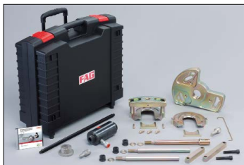
Slika 2: 400 6199 10 – Specijalan alat je obavezan za popravku