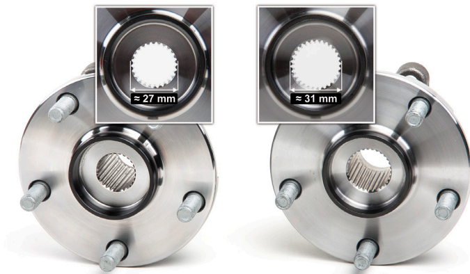
איור 2: הקוטר של שיני ההזחה בקצה הציריה שונה