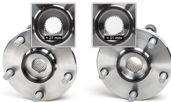
Slika 2: Promjer utora zgloba konstantne brzine razlikuje se