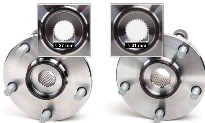
Slika 2: Prečnik ozubljenja homokinetičkog zgloba je različit