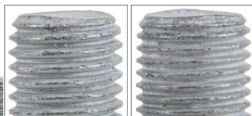
Εικόνα 1: Αριστερή βίδα: M12x1,5 Δεξιά βίδα: M12x1,25

Κατά τη μαζική παραγωγή, ο κατασκευαστής του οχήματος τοποθέτησε διαφορετικά ρουλεμάν τροχών με διαφορετικά βήματα σπειρωμάτων.