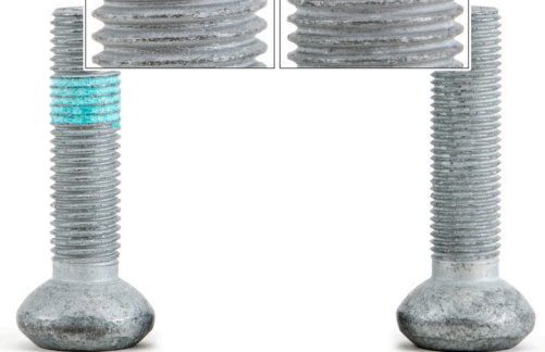
איור 1: בורג שמאל: M12x1,5 בורג ימין: M12x1,25

בעת החלפת מיסבי גלגל, חובה להשתמש בכל הברגים אשר מסופקים בסט מיסבי הגלגל מתוצרת FAG. זוהי הדרך היחידה בה ניתן להבטיח בוודאות כי התברגים אשר על אוגן (תושבת) המיסב זהים לברגים המסופקים בערכת מיסבי הגלגל.