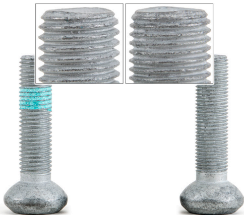
1. ábra: Bal oldali csavar: M12x1,5 Jobb oldali csavar: M12x1,25

A jármű gyártója a sorozatgyártásban különböző kerékcsapágyakat eltérő menetemelkedéssel alkalmazott.