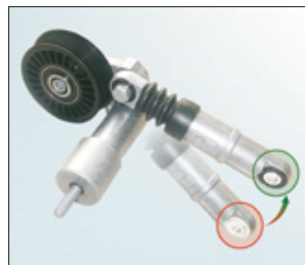
Fig. 2: 534 0014 10 - uitvoering met witte en zwarte kunststofogen op hydr. demper

Deze zorgt voor een aanzienlijke ontlasting van alle componenten binnen de aggregaataandrijving.