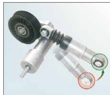
Slika 2: 534 0014 10 - izvedba z belimi in črnimi plastičnimi ušesi na hidravličnem blažilniku