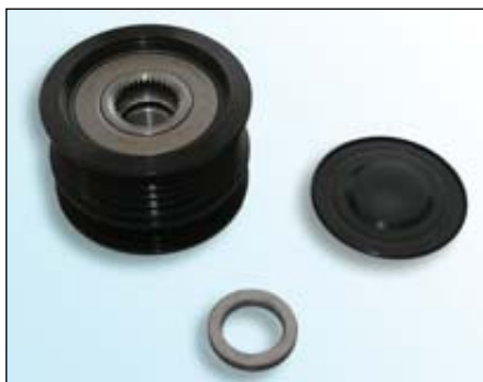
Slika 1: 535 0116 10