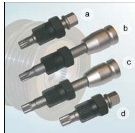
Slika 3: Pregled specijalnih sprava

Vodite računa o podacima proizvođača vozila!