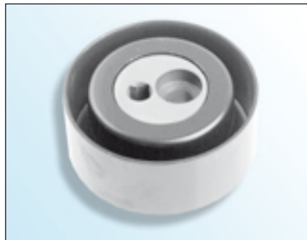
Fig. 1: Looprol van metaal

In het kader van de voortdurende verdere ontwikkeling van onze producten is het loopvlak van de spanrol 531 0148 10 gewijzigd van metaal in kunststof.