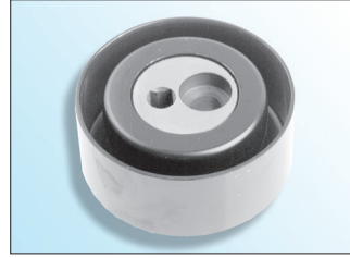
Resim 1: Metal gergi rulmanı