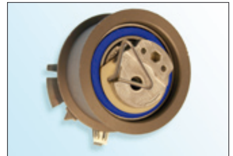
Fig. 2: 531 0565 30 (nieuwe uitvoering)