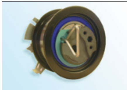
Fig. 1: 531 0565 30 (oude uitvoering)

Deze service-info toont de uiterlijke kenmerken van de 'oude uitvoering' en de 'nieuwe uitvoering'.