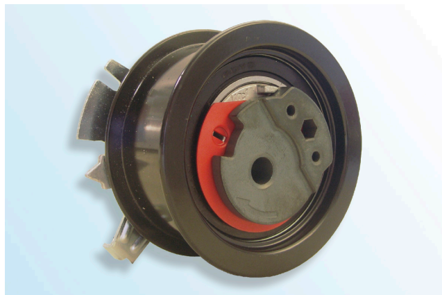
Obrázek 1: 531 0628 30 (staré provedení)

Tato servisní informace uvádí optické charakteristiky „starého“ a „nového“ provedení.