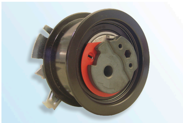
Рисунок 1: 531 0628 30 (старая версия)

Эта техническая информация показывает видимые различия «старой версии» и «новой версии».