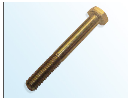
Slika 2: Originalni vijak

V sklopu neprestanega izpopolnjevanja naših izdelkov in zagotavljanja kakovosti dobavlja, LuK AS z napenjalnim valjem (531 0274 30) nov vijak (slika 3).