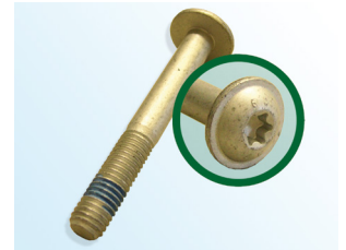
Kuva 3: LuK-AS-ruuvi

Jatkuvan tuotekehityksemme puitteissa toimittaa LuK-AS kiristinpyörän 531 0342 30 mukana uuden ruuvin (kuva 3).