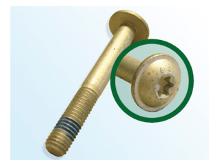
Рисунок 3: Schaeffler Automotive Aftermarket болт

В соответствии с непрерывным развитием нашей продукции и гарантии качества, Schaeffler Automotive Aftermarket в данный момент поставляет новый болт (рис.3) с натяжным роликом 531 0342 30.