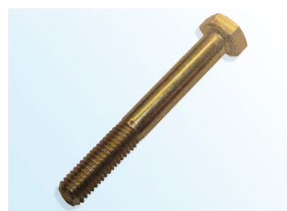
Рисунок 2: «Оригинальный» болт