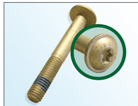
Slika 2: rezervni vijak

LuK-AS preporučuje zamijeniti postojeći vijak ( slika 2 ) novo isporučenim vijkom.