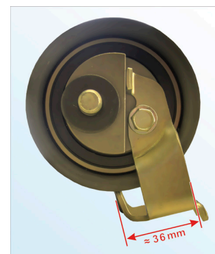
Рисунок 2: 531 0500 20

При замене натяжного ролика ремня ГРМ, должно быть проверено точное размещение на автомобиле.