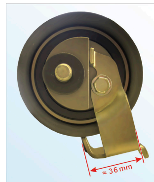
Зображення 2: 531 0500 20

Під час заміни натяжного ролика ременя приводу ГРМ необхідно звернути увагу на точну відповідність натяжного ролика певній моделі автомобіля.