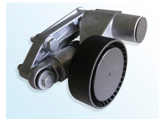
Εικόνα 2: 533 0097 10