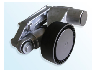
Figur 2: 533 0097 10 (hydraulisk design)