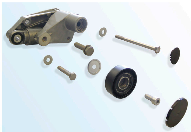
Figur 3: 533 0097 10 – Leveringsomfang

Den mekaniske spennarmen 533 0015 10 (Bilde 1) i originalt utstyr har blitt erstattet av en spennenhet med hydraulisk demping (Bilde 2).