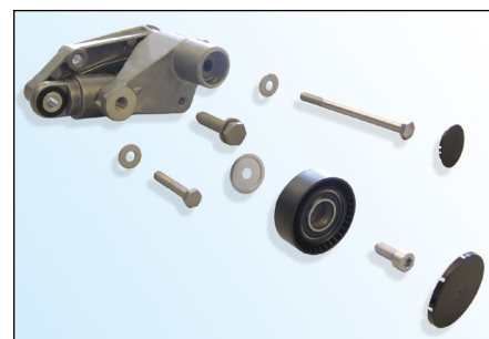
Obr. 3: Rozsah dodávky

Príslušný montážny návod je priložený v balení.