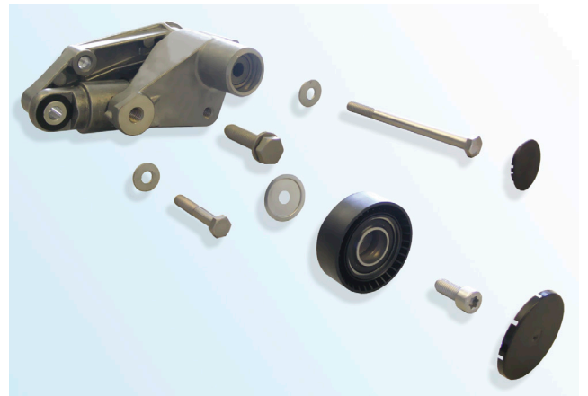
Зображення 3: Комплект постачання

Механічна натяжна планка 533 0015 10 була замінена на гідравлічну натяжну планку 533 0097 10.