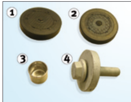
Fig. 1: Inhoud

Bij het vervangen van de genoemde spanrolkits en -sets moeten tegelijkertijd de in Fig. 1 getoonde componenten worden vervangen. Als extra service stelt Schaeffler Automotive Aftermarket deze componenten als onderdeel van het pakket ter beschikking.