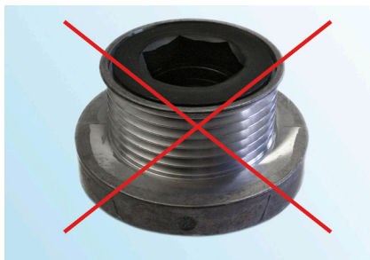
Снимка 1: 535 0117 10

Ремъчната ролка за генератор 535 0117 10 (снимка 1) вече не се предлага и е заменена с механизъм за свободен ход на генератор 535 0105 10 (снимка 2).