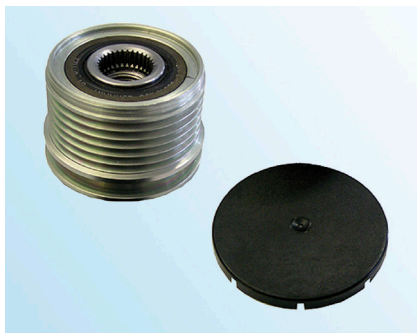
Снимка 2: 535 0105 10

Ремъчната ролка за генератор 535 0117 10 (снимка 1) вече не се предлага и е заменена с механизъм за свободен ход на генератор 535 0105 10 (снимка 2).