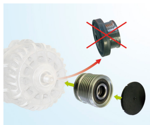
Obr. 3: Náhrada výrobku