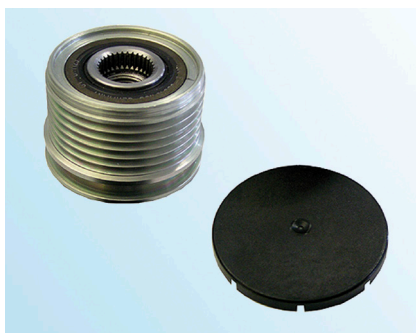
Billede 2: 535 0105 10

Svingningsdæmper i LuK-AS-nr. 535 0117 10 (figur 1) leveres ikke mere og er blevet erstattet med ordrenr. 535 0105 10 (figur 2).