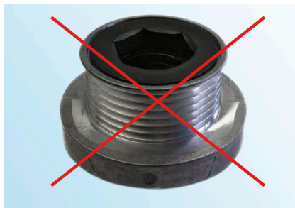
Billede 1: 535 0117 10

Svingningsdæmper i LuK-AS-nr. 535 0117 10 (figur 1) leveres ikke mere og er blevet erstattet med ordrenr. 535 0105 10 (figur 2).