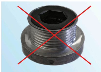
Εικόνα 1: 535 0117 10

Ο αποσβεστήρας κραδασμών με τον κωδ. INA 535 0117 10 (εικόνα 1) δεν είναι πλέον διαθέσιμος και αντικαταστάθηκε από τον κωδικό προϊόντος 535 0105 10 (εικόνα 2).