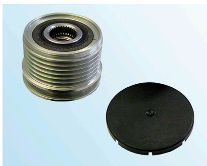
Εικόνα 2: 535 0105 10

Ο αποσβεστήρας κραδασμών με τον κωδ. INA 535 0117 10 (εικόνα 1) δεν είναι πλέον διαθέσιμος και αντικαταστάθηκε από τον κωδικό προϊόντος 535 0105 10 (εικόνα 2).