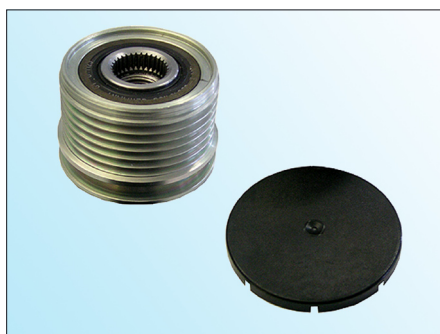
Imagen 2: 535 0105 10

El amortiguador de oscilaciones con Referencia 535 0117 10 (Imagen 1) ha sido sustituido por el artículo con Referencia 535 0105 10 (Imagen 2).