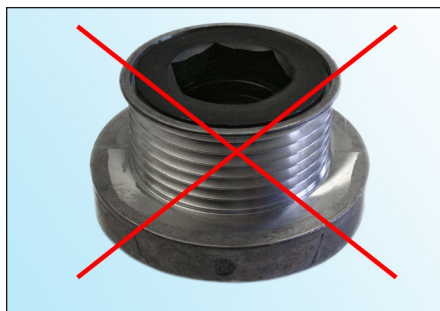
Imagen 1: 535 0117 10

El amortiguador de oscilaciones con Referencia 535 0117 10 (Imagen 1) ha sido sustituido por el artículo con Referencia 535 0105 10 (Imagen 2).