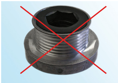
Kuva 1: 535 0117 10

Värähtelyvaimenninta LuK-AS Nrot 535 0117 10 (kuva 1) ei enää toimiteta ja se on korvattu tilausnumerolla 535 0105 10 (kuva 2).