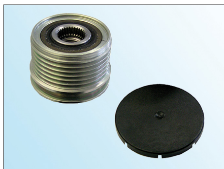
Slika 2: 535 0105 10

Amortizer vibracija u LuK-AS-br. 535 0117 10 (slika 1) se više ne isporučuje i zamijenjen je proizvodom s br. za narudžbu 535 0105 10 (slika 2).