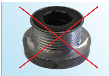
Slika 1: 535 0117 10

Amortizer vibracija u LuK-AS-br. 535 0117 10 (slika 1) se više ne isporučuje i zamijenjen je proizvodom s br. za narudžbu 535 0105 10 (slika 2).