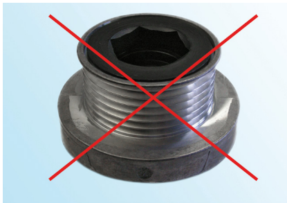
Figur 1: 535 0117 10

Generatorremskiven 535 0117 10 (Fig. 1) er ikke lenger tilgjengelig og har blitt skiftet ut med friløpremskiven OAP 535 0105 10 (Fig. 2).