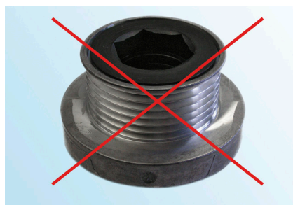
Figura 1: 535 0117 10

Fulia alternatorului 535 0117 10 (Fig. 1) nu mai este disponibilă, fiind înlocuită cu fulia de alternator cu sistem de rolă liberă 535 0105 10 (Fig. 2).