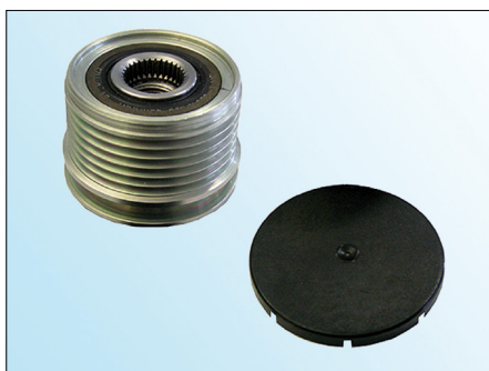
Slika 2: 535 0105 10

Dušilnik nihanj s št. LuK-AS 535 0117 10 (slika 1) se ne dobavlja več. Zamenjal ga je dušilnik s katal. št. 535 0105 10 (slika 2).