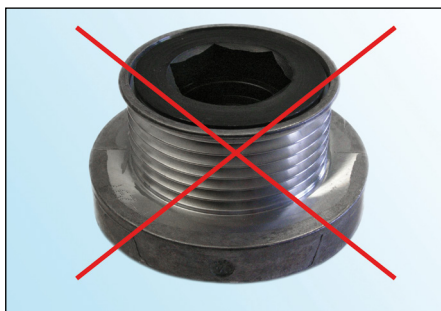
Slika 1: 535 0117 10

Dušilnik nihanj s št. LuK-AS 535 0117 10 (slika 1) se ne dobavlja več. Zamenjal ga je dušilnik s katal. št. 535 0105 10 (slika 2).