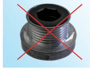
Şekil 1: 535 0117 10

Alternatör kayışı makarasındaki bir arıza ana tahrik kayışıyla sorun yaşanmasına ve pahalı hasarlara neden olabilir.