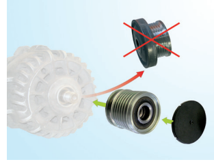
Şekil 3: Değişimin gösterimi