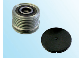
Şekil 2: 535 0105 10