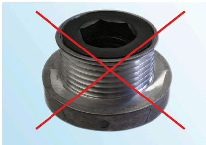
Зображення 1: 535 0117 10

Шків генератора з демпфером LuK-AS-N° 535 0117 10 (див. зображення 1) більше не поставляється, він замінений на шків генератора з обгінною муфтою 535 0105 10 (див. зображення 2).