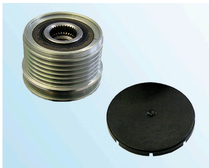
Зображення 2: 535 0105 10

Шків генератора з демпфером LuK-AS-N° 535 0117 10 (див. зображення 1) більше не поставляється, він замінений на шків генератора з обгінною муфтою 535 0105 10 (див. зображення 2).