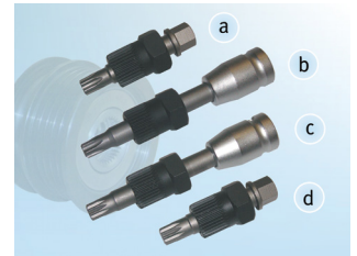
Kuva 2: INA erikoistyökalut