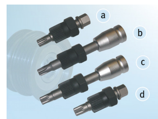
Figur 2: Oversikt over spesialverktøy