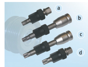
Рисунок 2: Обзор специнструмента