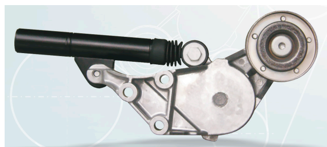
Billede 1: Strammeenhed 533 0081 30 - anvendt ved motorer 1,9 TDI

*) SH → strammeenhed GFL → generatorfriløb