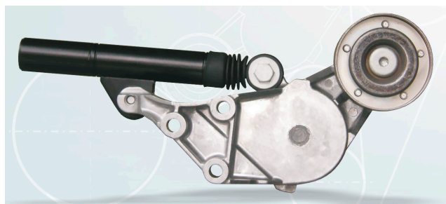
Εικόνα 1: Τεντωτήρας 533 0081 30 - χρησιμοποιείται σε κινητήρες TDI 1.9

Ζητάτε περισσότερα; Μπορούμε να βοηθήσουμε! Schaeffler Greece schaefflergr@schaeffler.com https://aftermarket.schaeffler.gr www.repxpert.gr