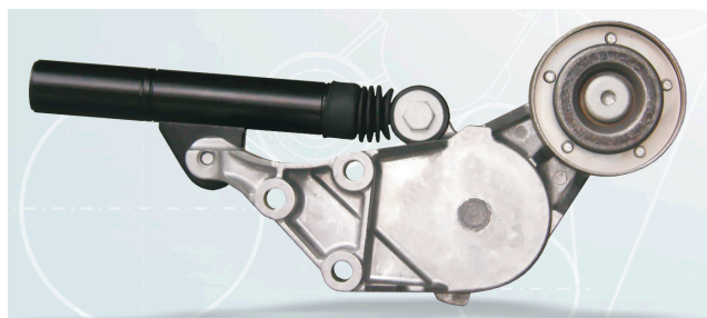
1. ábra: 533 0081 30 cikkszámú feszítőegység - az 1.9 TDI-motorokban alkalmazzák

*) SH -> Feszítőegység GFL -> Generátor-szabardonfutó