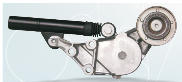
Bild 1: Spännenhet 533 0081 30 - används hos motorer 1.9 TDI

*) SH -> spännenhet GFL -> frinavremskiva