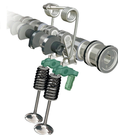
Снимка 1: Преглед на BMW Valvetronic