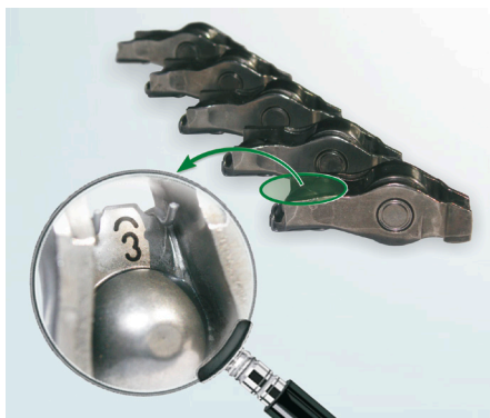
2. ábra: Görgős szelepemelők feliratai

A szelepemelők cseréjét azonos osztályba sorolttal kell elvégezni.