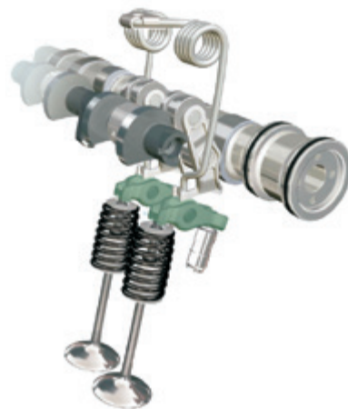
Imagem 1: Visão geral do BMW Valvetronic

Os motores BMW Valvetronic e PSA estão equipados com balanceros graduados no lado da válvula de admissão e no lado da válvula de escape.